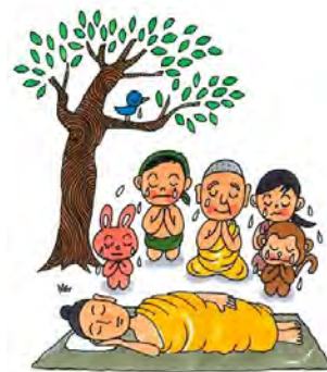
参考…本願寺プラハンドブック