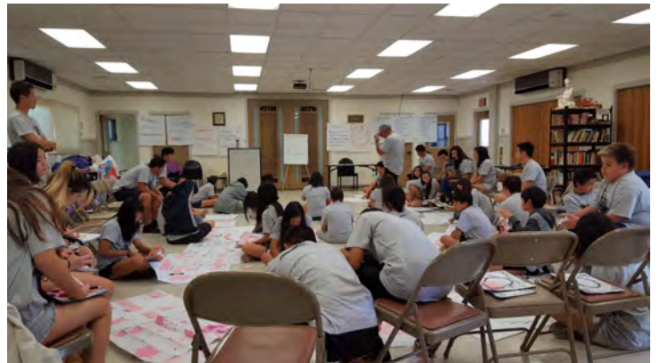
たいしょう きゃんぷ こどもを対象としたYES Sキャンプがありました。