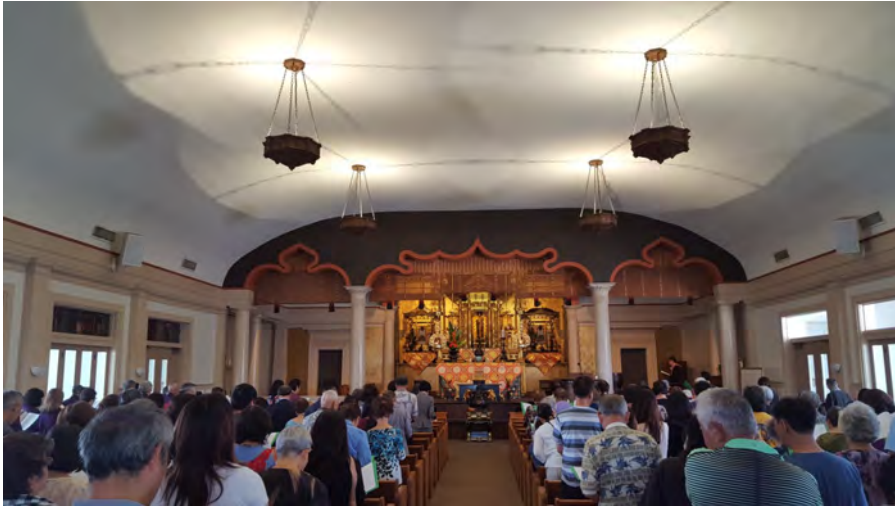
ひがんほうよう としませんせい てねすせんせい せつきょう はるのお彼岸法要のようす 戸島先生、テネス先生のお説教