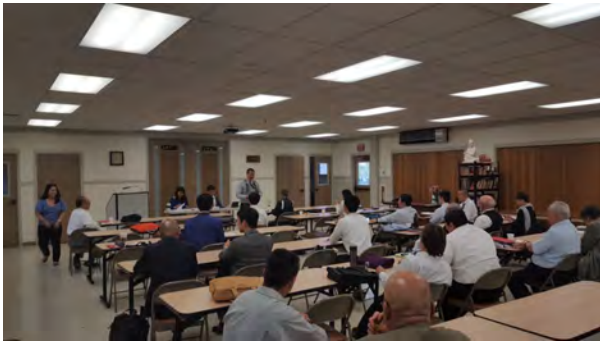
りゅうこくだいがく せみな 龍谷大学BSCセミナー