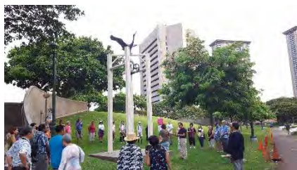
へいわ ねが び すうおく 平和を願う「ピースウォーク」 はわいべついん しやくしょ ながさき へい ハワイ別院から市役所の長崎の平 わ かね ある 和の鐘まで歩いていきました。