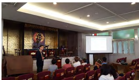
がつ にち こどもをたいしょう 7月16、17日 子どもを対象と した Jr. YESS camp.