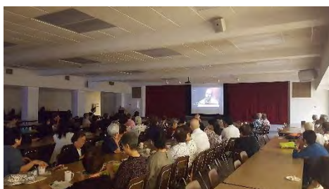
はわい むすりむ えいがじょうえい 「ハワイのムスリム」の映画上映