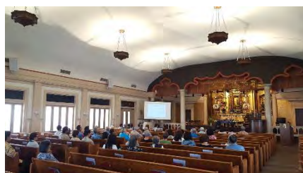
ごうどう ほんまい ほうよう 合同お盆参り法要