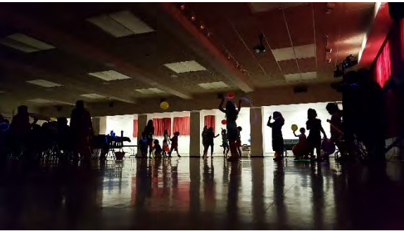
ダンス&ディナー パーティー

ことができません。悲しい別れの中にも、お浄土で再び会えることができる浄土真宗の道と共によるごぶ、歩んで参りましょう。そして、「まいるはからいをするにあらず まいらしてくださいるをまつばかりなり」とあるように、仏さまが迎えとつて、お浄土へと連れてい