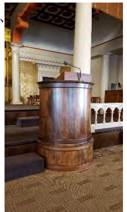
先月のご寄附の写真は、この説教台でした。