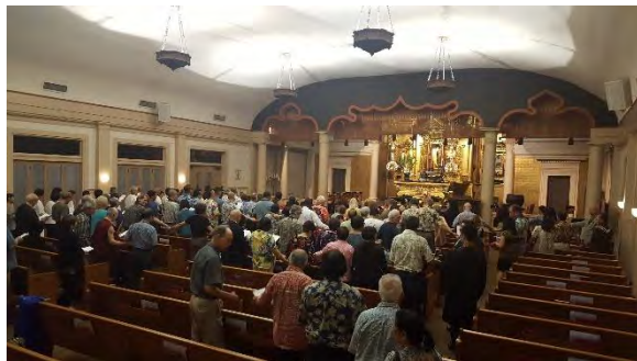
平和記念サービス