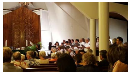
だい ぬ あう ごうどうかんしゃさい べついでんがっしょうだん 第54回ヌアウ合同感謝祭 別院合唱団

おし しつもん にちようび さーびす かね なんかい 教えて、せんせい！ 質問 日曜日のサービスの鐘は何回たた くのですか？ 答え 回数は7打、打ち上げ打ち下し（小刻 みから大きくし、頂点からまた小さくなっていく）、5打、 打ち上げ打ち下し、3打（大小大）です。（右図）この鐘は 喚鐘または行事鐘と呼ばれ、サービスが始まる合図で す。お話を止め、仏法を聞く心を整えさせていただきた いものです。ワヒアワとワイアルア本願寺には梵鐘という 大きな鐘があり、これは集会鐘と呼ばれお勤めの30分、1 時間前に10打撞かれ、サービスがあることを知らせます。