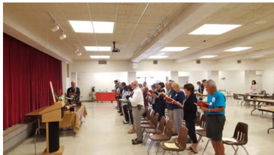
おあふ ほの るるごうどうねんぶつ つど オアフ・ホノルル合同念仏の集い