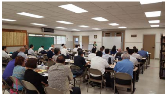
がつ かいきょうしせみ な 11月の開教使セミナー