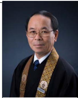
おんぼん 輪番 おんとうたつ 宗藤達雄

護持 (月刊) 発行所 本派本願寺ハ ワイ別院 1727 Pali highway, Honolulu HI, 96813 Tel: (808) 536-7044 E-Mail: