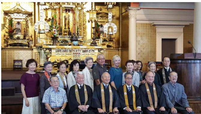
いんたいかいきょうしゃんしゃ さーびす 引退開教使感謝のサービス