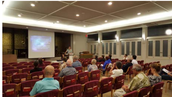
じさつよぼうせみ なー 自殺予防セミナー